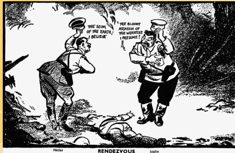
David Low, syyskuu 1939. "Maailman pohjasakkaa, uskoakseni." "Työläisten verinen murhaaja, otaksun."

Pilakuvat ovat yleensä aikalaislähteitä. Ne heijastavat oman aikansa yhteiskuntaa ja tapahtumia. Pilapiirroksen tulkinnassa kannattaa lähteä liikkeelle kuvan julkaisuajan kohdasta ja tekijästä. Julkaisuajankohdasta kertoo, missä ajassa liikutaan. Tekijän tai julkaisijan kansalaisuus ja taustat taas kertovat, missä liikutaan. Nämä ovat oleellisia tietoja kuvaa tulkittaessa. Analyysia jatketaan kuvan henkilöiden, toiminnan ja miljöön tarkastelulla. Ilmeet, eleet, kehon kieli, pukeutuminen, esineet ja muut viitteet kannattaa huomioida. Tunnetut henkilöt pitäisi yrittää tunnistaa nimeltä.